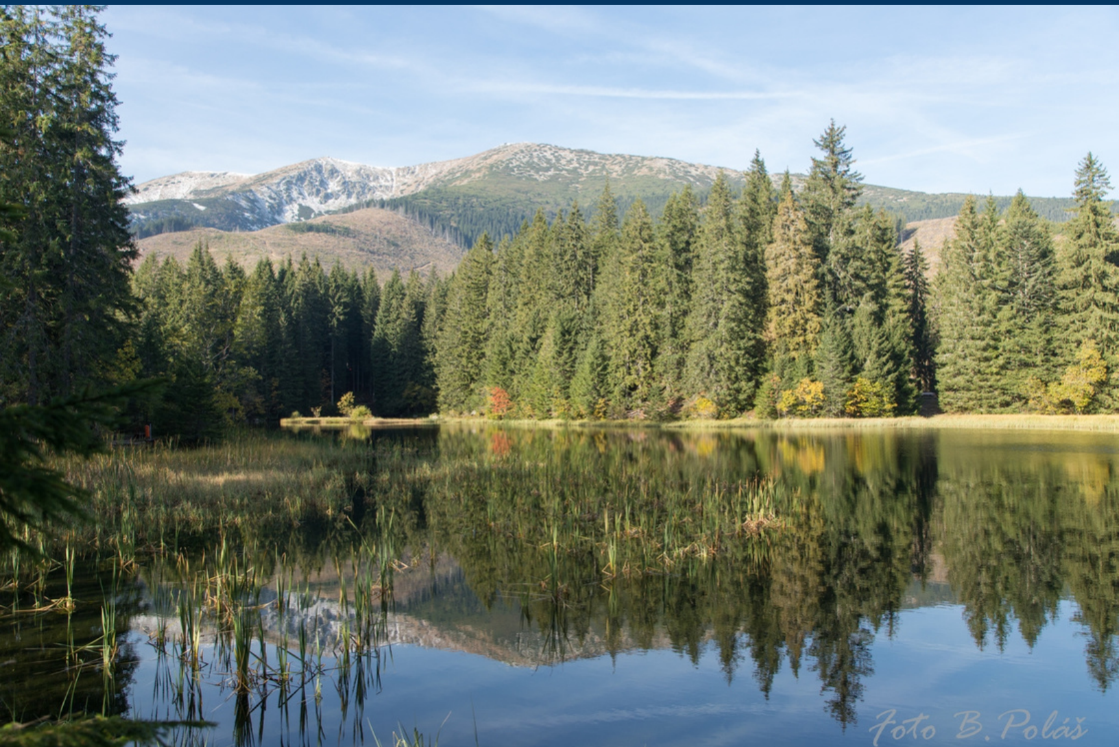
Vrbské pleso v Demänovskej doline v Nízkyh Tatrách