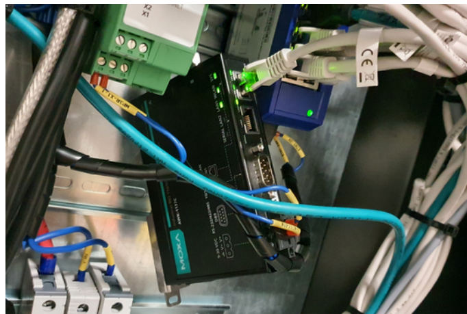
Detail zapojenia wifi-modulu MOXA AWK-1137C v AGV ťahači.

Moduly od spoločnosti SOFOS, a. s., s ktorou naša spoločnosť spolupracuje už od roku 2013, spĺňajú náročné požiadavky kladené na AGV ťahače ako je najmä spoľahlivosť a stabilita pripojenia.